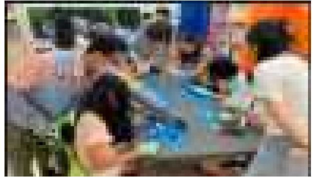
노인일자리 및 사회활동지원사업