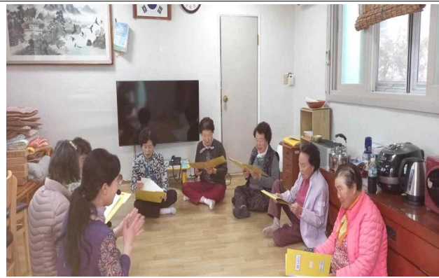
대한노인회 금정구지회 특화·활성화 프로그램